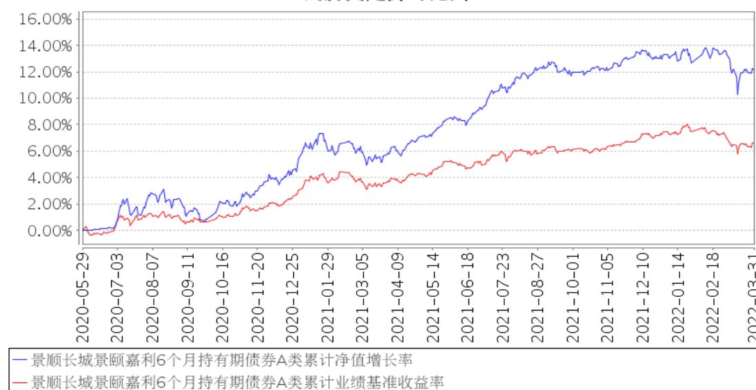
景顺长城景颐嘉利6个月持有期债券A类累计净值增长率与同期业绩比较基准收益率的历史走势对比图