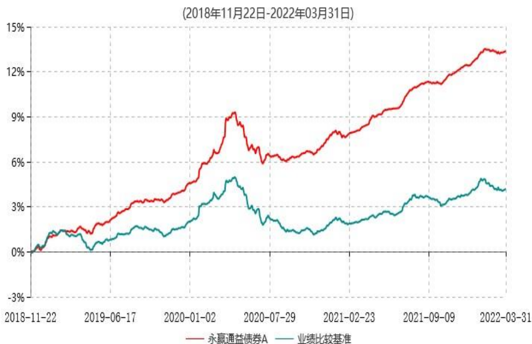
永赢通益债券A累计净值增长率与业绩比较基准收益率历史走势对比图