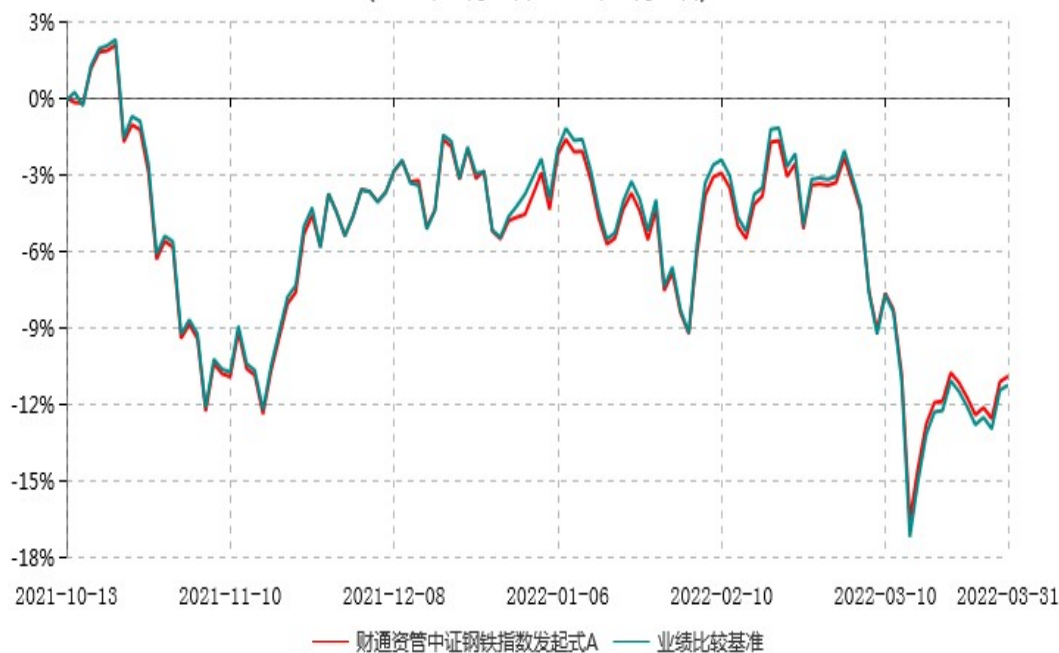
财通资管中证钢铁指数发起式A累计净值增长率与业绩比较基准收益率历史走势对比图 (2021年10月13日-2022年03月31日)