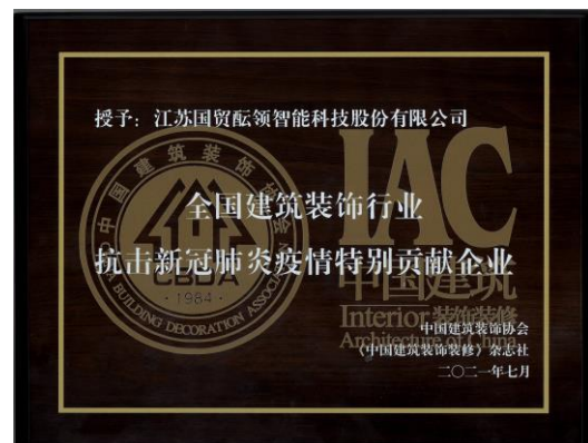
公司获中国建筑装饰协会授予的抗击新冠肺炎疫情特别贡献企业荣誉称号