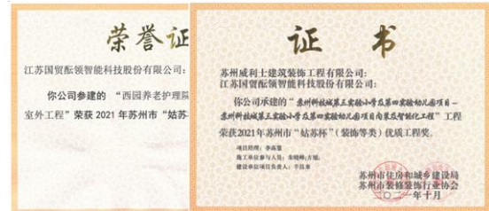
公司实施苏州科技城第三实验小学及第四实验幼儿园项目、西园养老护理院项目被授予 2021 年苏州市“姑苏杯”优质工程奖