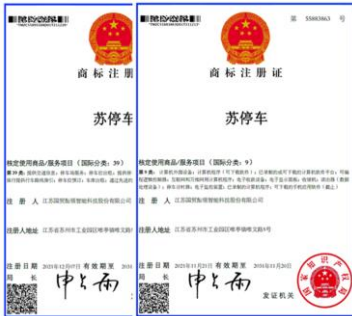
公司成功通过“苏停车”商标注册