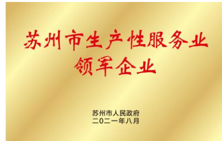
公司获“苏州市第二批生产性服务业领军企业”荣誉称号，并获奖励资金 100 万元