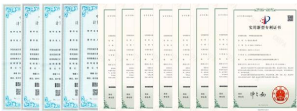
公司新获实用新型专利 8 项、软件著作权 5 项，累计拥有实用新型专利 18 项，软件著作权 84 项，发明专利 2 项