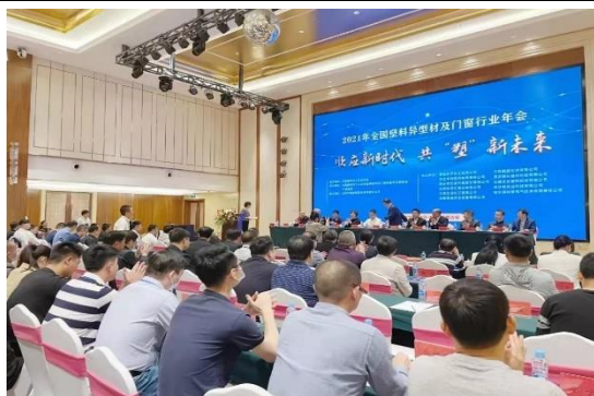
公司技术总工参加2021年全国塑料异型材及门窗行业年。