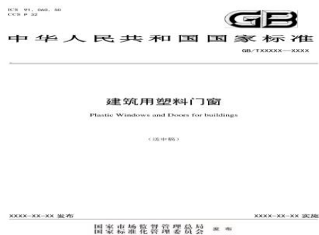
公司参加《建筑用塑料门窗》国家标准的编制工作。