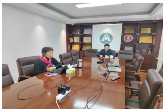
公司工程师参加2021年塑料门窗及建筑装饰制品的线上会议。