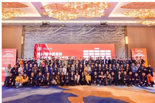
公司组织会员单位参加第23届中国国际门窗幕墙技术交流研讨会。