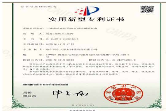
公司一种带填充层的防水型塑钢外开窗；一种防火铝塑共挤门窗型材；一种带填充层的塑钢门窗型材；一种塑钢门窗框中空式型材；一种防火防烟门窗结构；一种防水型塑钢外开窗型材等多项专利获得授权。