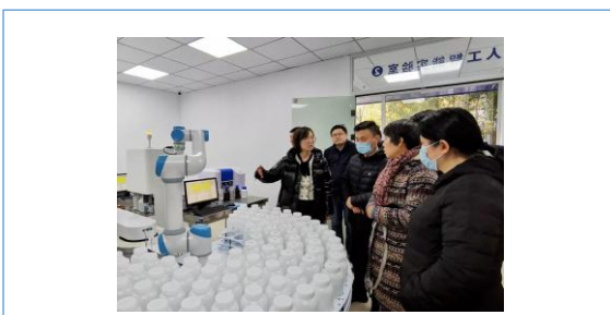
北裕仪器与杭州市环境监测站签订 人工智能 AI 实验室合作协议