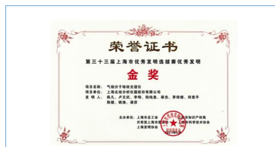
气相分子吸收光谱仪荣获上海市第 33 届 市优秀发明展 “金奖”