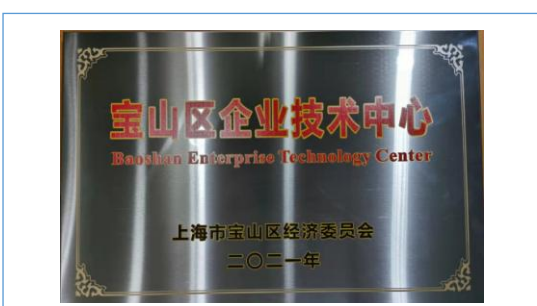
荣获“宝山区企业技术中心”认定