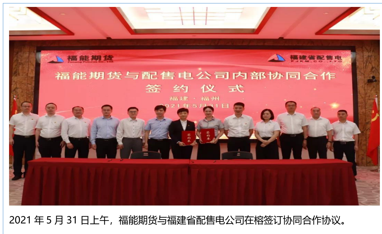
2021年5月31日上午，福能期货与福建省配售电公司在榕签订协同合作协议。

2021年10月，公司在第十四届中国最佳期货经营机构评选中获得了“中国最具成长性期货公司、中国期货公司金牌管理团队、最佳金融期货服务奖、最佳企业品牌建设奖、最佳商品期货产业服务奖、最佳中国期货经营分支机构、最佳宏观策略分析师、最佳农副产品期货分析师、中国期货公司年度最佳掌舵人”等荣誉。