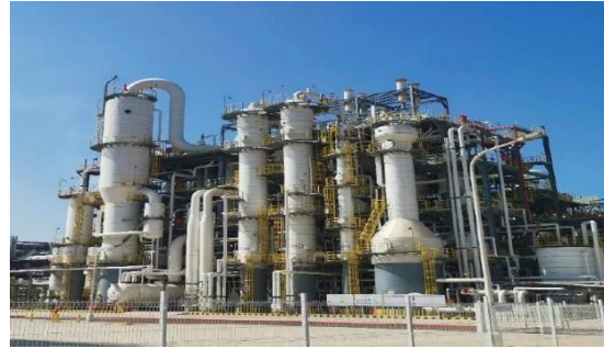
以 FEP 和 FRP 制成的盐酸吸收塔 (尺寸 D2.4xH18m)