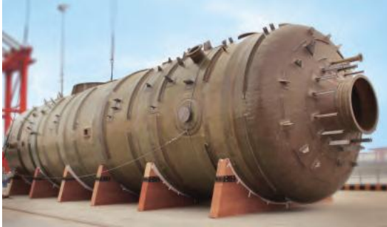
以 FRP 制成的废气洗涤塔 (尺寸: DN6500xH26,000mm)

公司提供的复合材料能应用于各种高强度酸性腐蚀工况和高温环境下，是中国国内少数能提供此类产品的厂家之一，处于细分市场的行业领先地位。陆续受邀参与共同起草了中国国家标准（即 GB/T 343292017《纤维增强塑料压力容器通用要求》）和中国化工行业标准（即 HG/T 4589-2014《化工用塑料管道粘接剪切检测方法》和 HG/T 4750-2014《塑料焊接机具 挤出焊枪》），中国国家标准（即 GB/T 35974.4-2018《塑料及其衬里制压力容器第 4 部分：塑料制压力容器的制造、检查与检验》），《ASMERTP-1》标准中国改编版（即“纤维增强塑料制压力容器标准”）的编制工作。