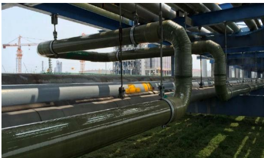
以 PP/FRP,PVC/FRP,PVDF/FRP 制成的盐酸输送管道 (尺寸: DN25-DN500)