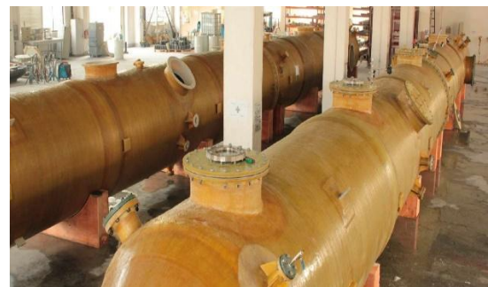
以 ECTFE +FRP 制成的盐酸反应塔 (尺寸 D1.8xH25m)