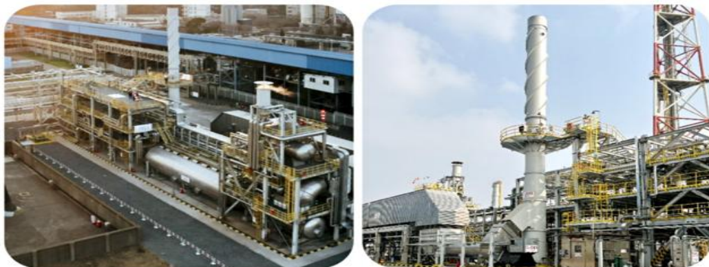
亚德公司承建的中央废气处理及能量回收项目

2021年，公司环境科技业务新签合同101个，新签合同额为6.46亿元，较去年同期增长304%，在执行项目117个，其中执行新生效合同占比约48%；报告期实现营业收入5.15亿元，较上年同期增长59.06%。