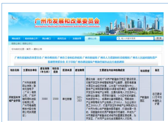
与广州科技贸易职业学院共建的开发区科学城产业学院入选广州市产教融合重大建设项目名单