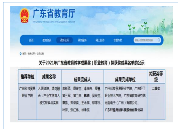
参与申报的“入园建院、课岗融合：产业学院育人模式探索与实践”项目获得 2021 年广东省教育教学成果奖（职业教育）二等奖