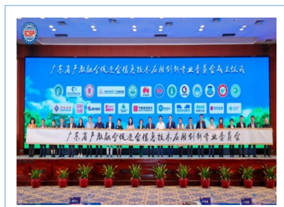
作为发起人单位参与广东省产教融合促进会信创专委会成立大会