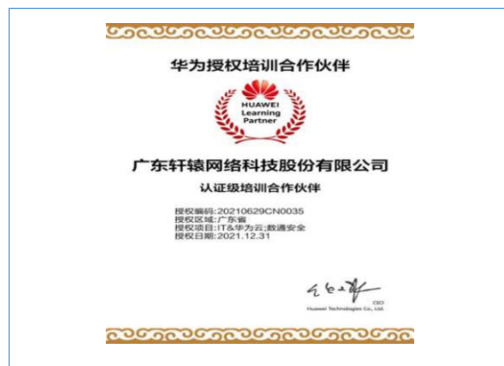
成为被授予华为认证级培训合作伙伴