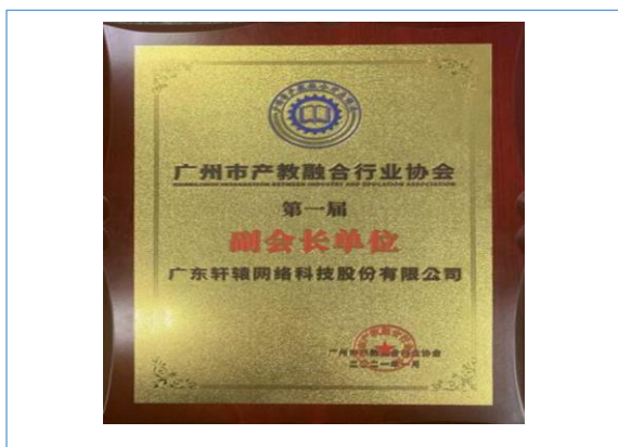
成为广州市产教融合行业协会第一届副会长单位