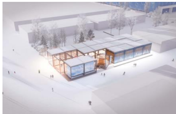
“阿里巴巴集团北京冬奥会企业展厅建筑设计项目” 设计中标并签约。