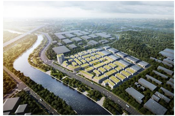
“中国（绵阳）科技城高端装备制造产业园标准厂房项目” 设计合同签约。