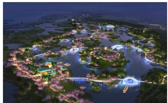
“长治市漳泽湖东岸生态修复与保护综合治理一期工程（三标段）” 设计中标并签约。