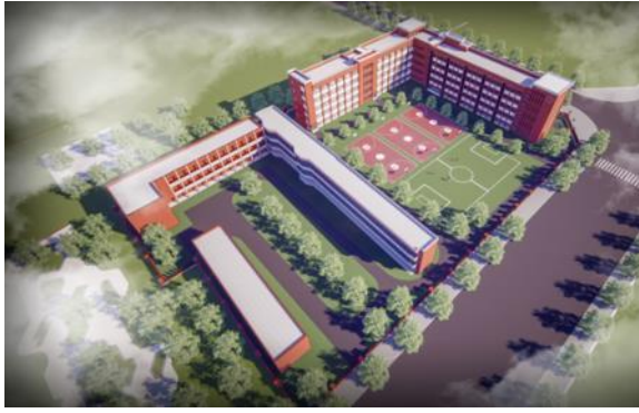
“兰考县兰阳第一小学改扩建项目” 设计中标并签约。