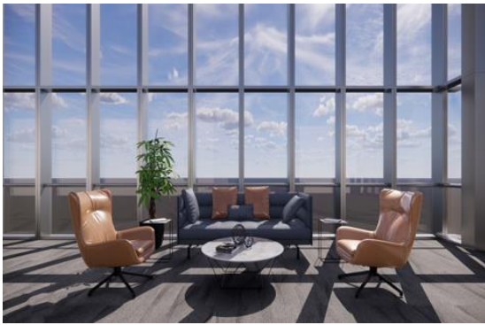
“中粮糖业有限公司办公室装修工程” 设计中标并签约。