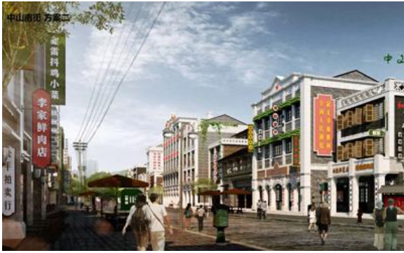
“中山南街提升改造项目方案设计” 设计合同签约。