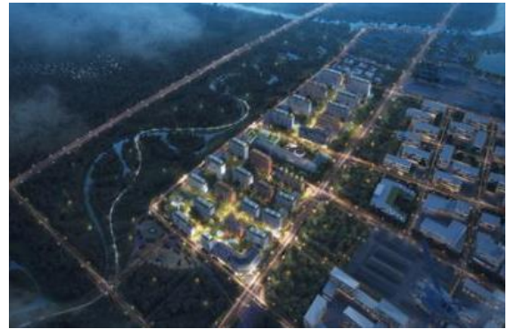
“北京市通州区宋庄镇小堡艺术区集体土地租赁住房项目概念规划” 设计中标并签约。