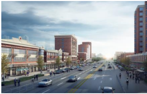
“黄河路提升改造（中山路至文明路）项目方案设计” 设计中标并签约。