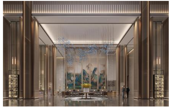
“阜阳淮河吾悦广场项目颍上星俪岚酒店室内精装设计” 设计合同签约。