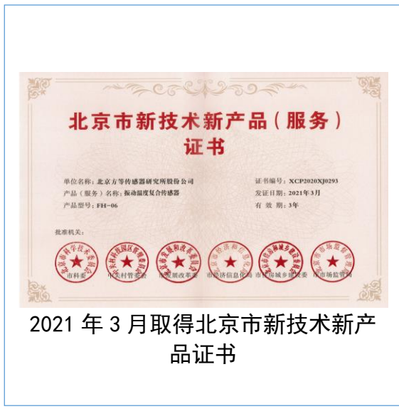
2021 年 3 月取得北京市新技术新产品证书