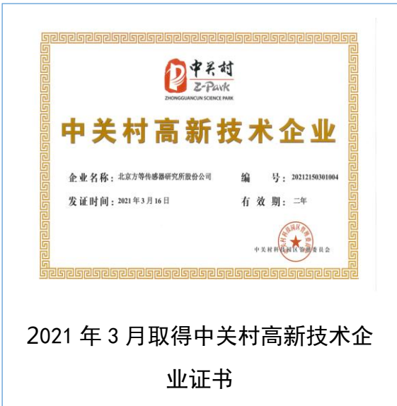
2021 年 3 月取得中关村高新技术企业证书