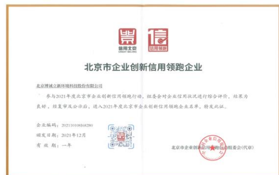
公司荣获 2021 年度 “北京市企业创新信用领跑企业”