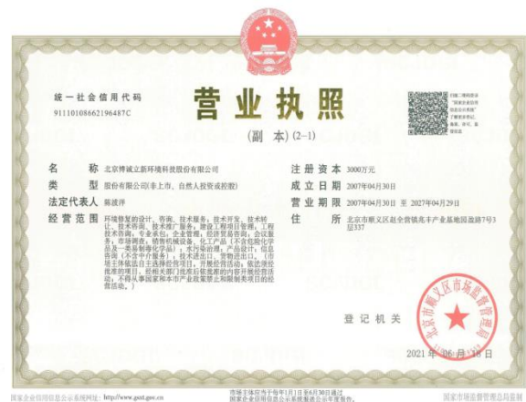
公司注册资本增加至 3000 万元