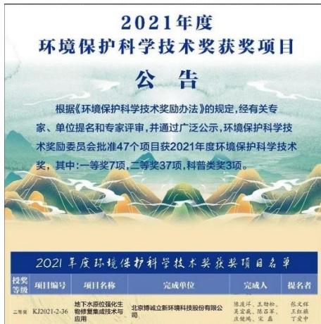
公司荣获环境保护科技奖 2021 年度二等奖