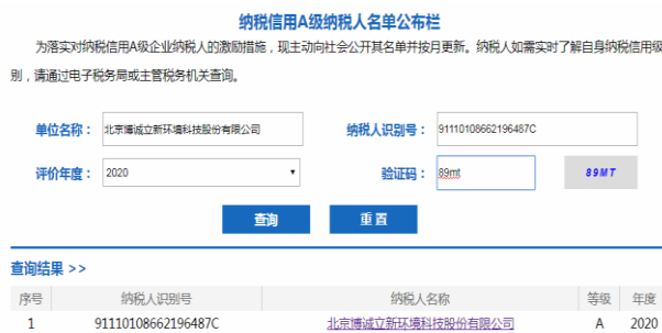
2020 年度纳税信用 A 级纳税人 公司已多年荣获此荣誉