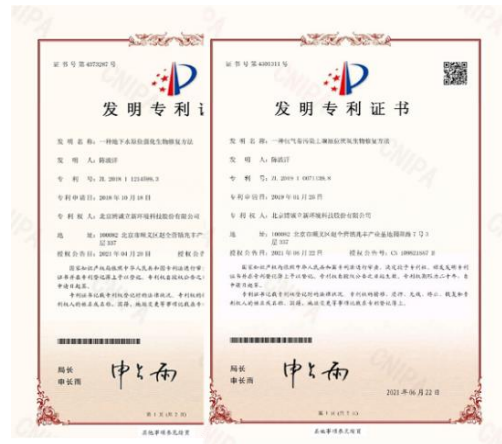
公司两项发明专利获得专利授权