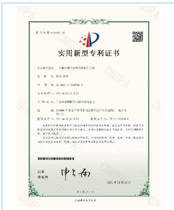
2021 年 10 月 15 日，公司取得“一种具有遮光结构的条码扫描器”实用新型专利证书。