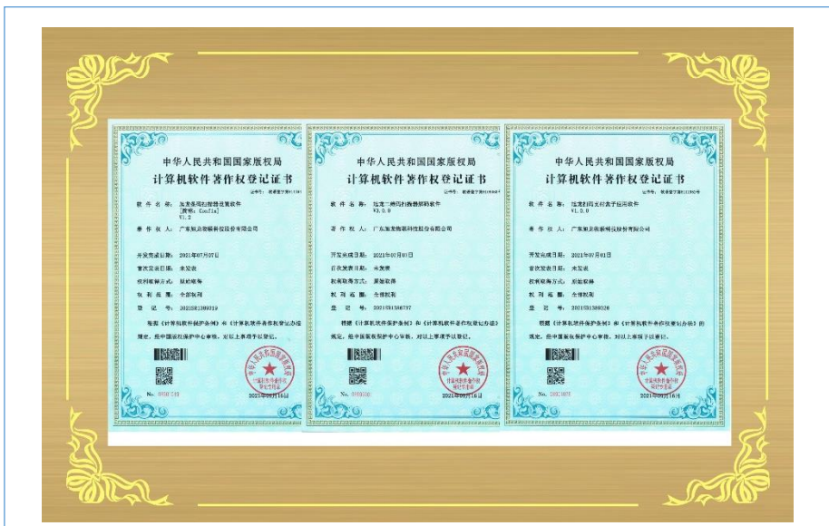
2021 年 9 月 16 日，公司通过国家版权局登记了旭龙扫描支付盒子应用软件 V1.0.0 (2021SR1389326)、旭龙条码扫描器设置软件[简称：Confix]V1.2 (2021SR1389319)、旭龙二维扫码器解码软件 V3.0.0 (2021SR1386737) 等 3 项计算机软件著作权。