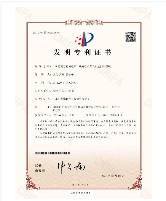
2021 年 8 月 10 日，公司取得“一种摆动器控制电路、装置以及激光识别扫码系统”国家发明专利证书。