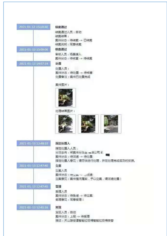
建筑垃圾智能收运系统接入天山路街道“一网统管”平台