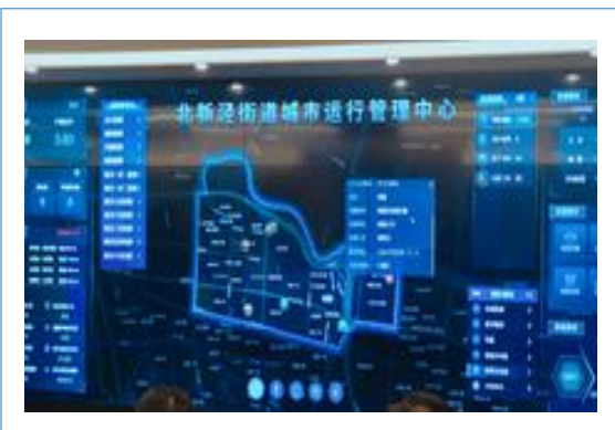
建筑垃圾智能收运系统接入“一网统管”平台