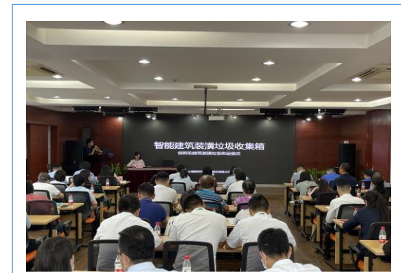
街道组织和社区物业的推广对接会