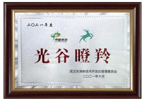
4、2021 年 10 月荣获武汉·光谷瞪羚企业荣誉。