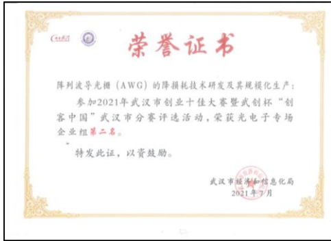
3、2021 年 7 月荣获市经信局 2021 年武汉市创业十佳大赛暨武创杯“创客中国”武汉市分赛评选活动第二名。