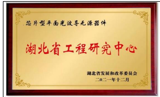
10、2021 年 12 月荣获湖北省发改委芯片型平面光波导无源器件湖北省工程研究中心认定。