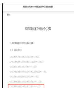
11、2021 年 12 月荣获省经信委省级企业设计中心认定。