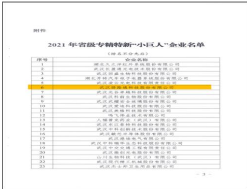
1、2021 年 4 月荣获省级专精特新“小巨人”企业荣誉称号。