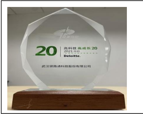
7、2021 年 11 月荣获德勤光谷高科技高成长 20 强奖杯。