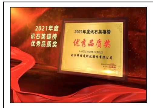
12、2021 年 12 月荣获 2021 年度讯石英雄榜优秀品质荣誉。