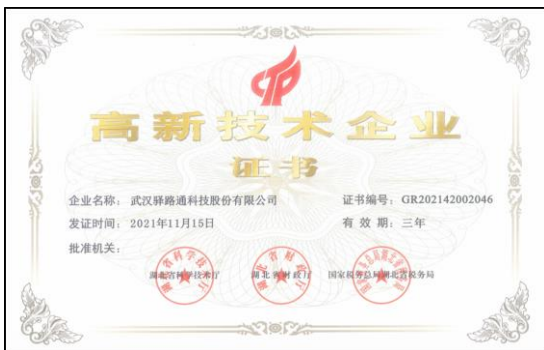
5、2021 年 11 月重新认定为国家级高新技术企业。