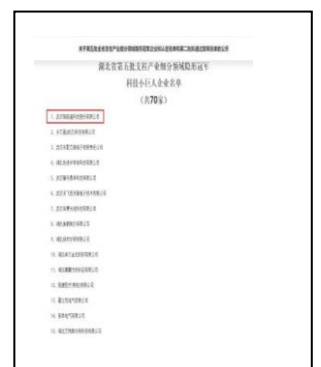
6、2021 年 11 月荣获湖北省第五批支柱产业细分领域隐形冠军科技小巨人企业称号。