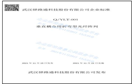
8、2021 年 11 月建立企业标准 Q_YLT-001-垂直耦合用折弯型光纤阵列