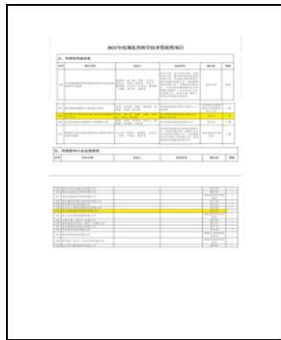
9、2021 年 12 月荣获 2021 年度湖北省科学技术奖三等奖以及科技型中小企业创新奖。