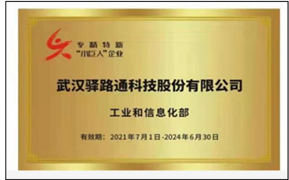
2、2021 年 7 月荣获国家级专精特新“小巨人”企业荣誉称号。