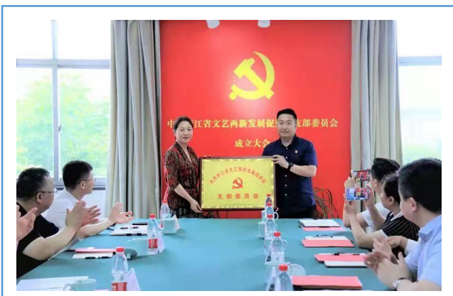
全国首个省级“文艺两新”党支部在“新青年”成立