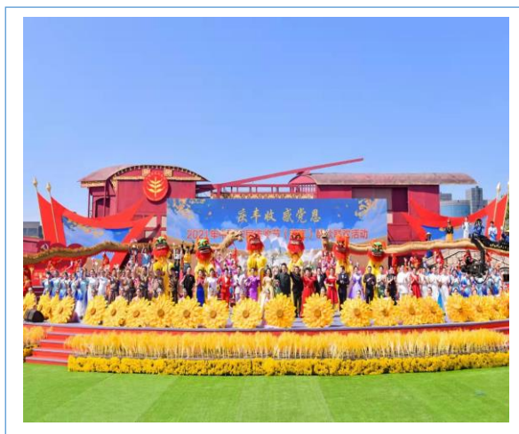
整体策划执行中国农民丰收节（浙江）联欢会