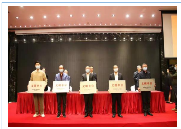
获评杭州市“文明单位”