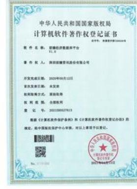
前瞻经济数据库平台