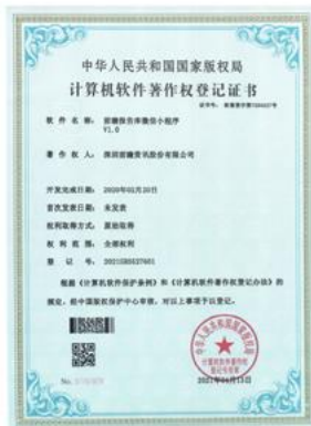
前瞻报告库微信小程序