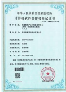
交通物流产业大数据监管平台