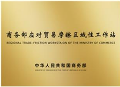
商务部应对贸易摩擦区域性工作站