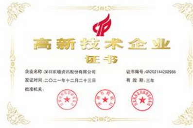
高新技术企业证书