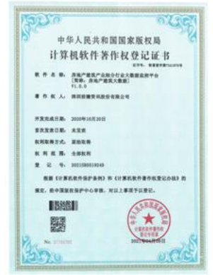
房地产建筑产业细分行业大数据监管平台