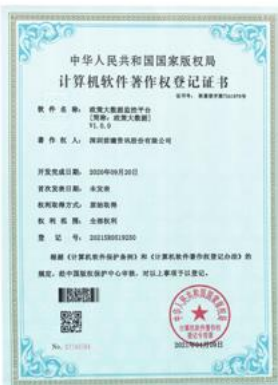
政策大数据监管平台