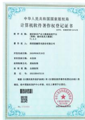
建材家具大数据监管平台