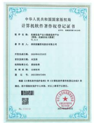
机械设备大数据监管平台