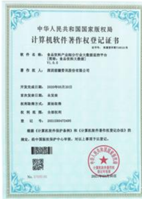
食品饮料产业细分行业大数据监管平台