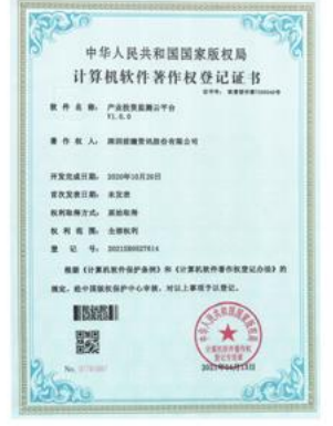
产业投资监测云平台