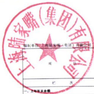
合并所有者权益变动表（续） 2021年度