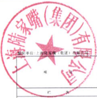
合并所有者权益变动表 2021年度