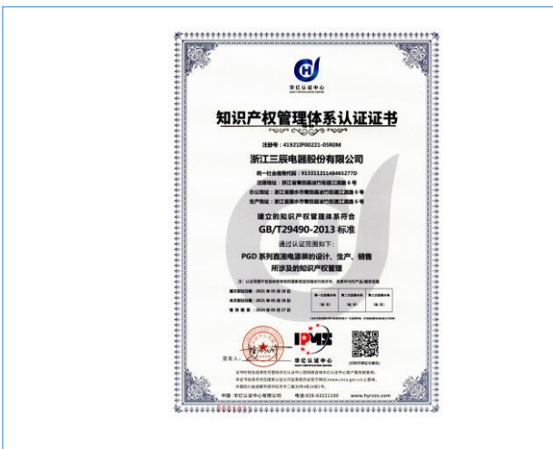
公司取得知识产权管理体系认证证书