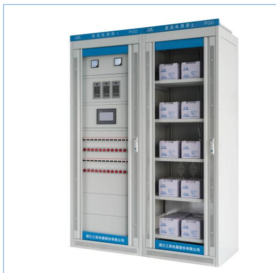
公司研发的“物联网型直流电源屏”被列入省内首台套设备