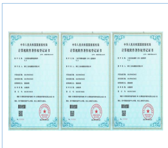
公司 2021 年新取得三项著作权证书