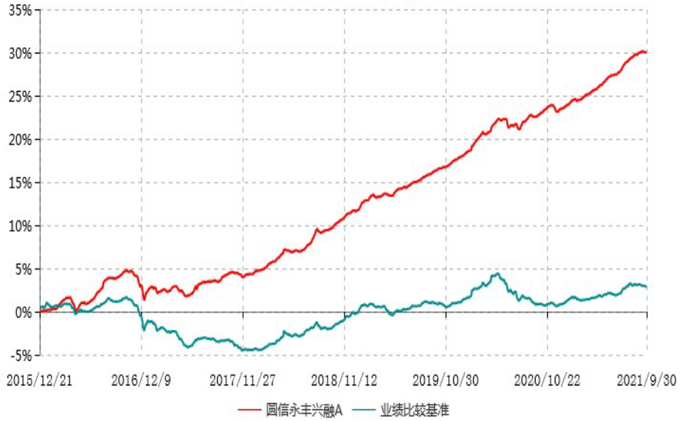
圆信永丰兴融A累计净值增长率与业绩比较基准收益率历史走势对比图 (2015年12月21日-2021年09月30日)