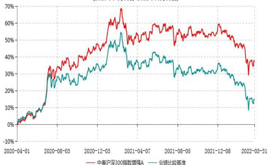
中泰沪深300指数增强A累计净值增长率与业绩比较基准收益率历史走势对比图 (2020年04月01日-2022年03月31日)