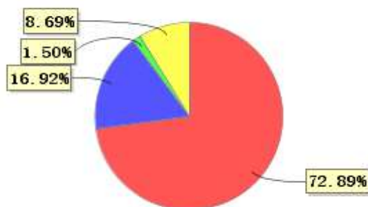
投资组合资产配置图表(2022年3月31日)

● 固定收益投资 ● 买入返售金融资产 ● 其他各项资产 ● 银行存款和结算备付金合计