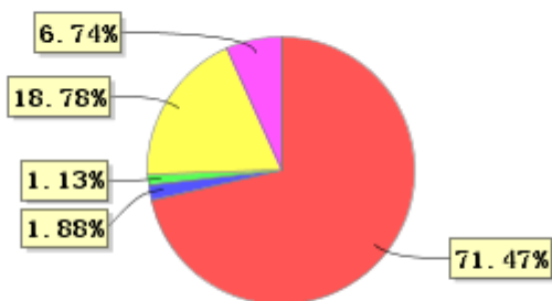
投资组合资产配置图表(2021年12月31日)

● 固定收益投资 ● 买入返售金融资产 ● 其他各项资产 ● 权益投资 ● 银行存款和结算备付金合计