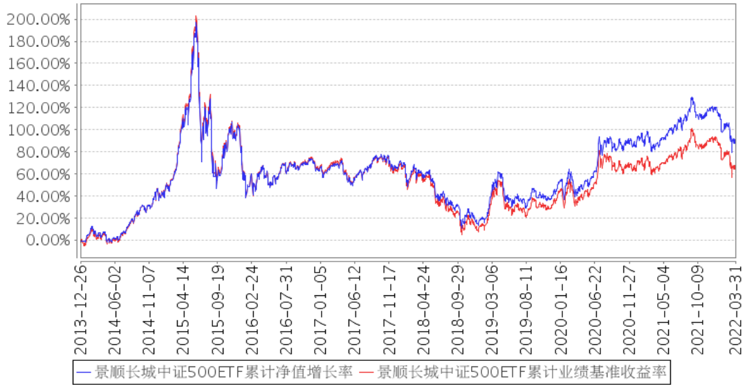
景顺长城中证500ETF累计净值增长率与同期业绩比较基准收益率的历史走势对比图

注：本基金的投资组合比例为：本基金投资范围主要为标的指数成份股及备选成份股，投资于标的指数成份股及备选成份股的比例不低于基金资产净值的 90%，且不低于非现金基金资产的 80%。本基金的建仓期为自 2013 年 12 月 26 日基金合同生效日起 6 个月。建仓期结束时，本基金投资组合达到上述投资组合比例的要求。