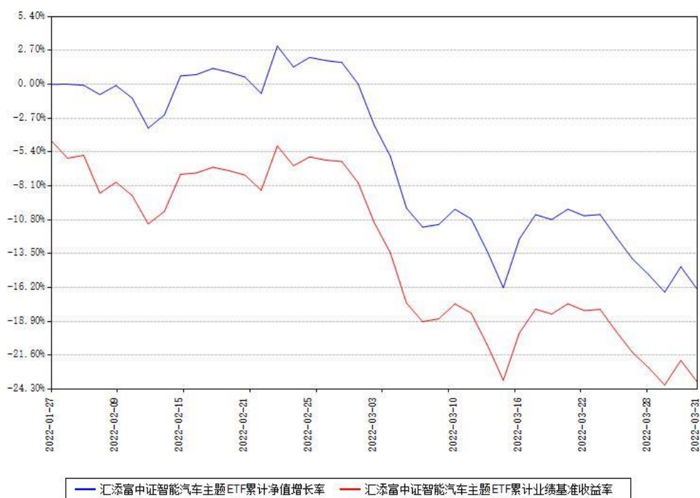
汇添富中证智能汽车主题ETF累计净值增长率与同期业绩基准收益率对比图

(二) 自基金合同生效以来基金累计净值增长率变动及其与同期业绩比较基准收益率变动的比较