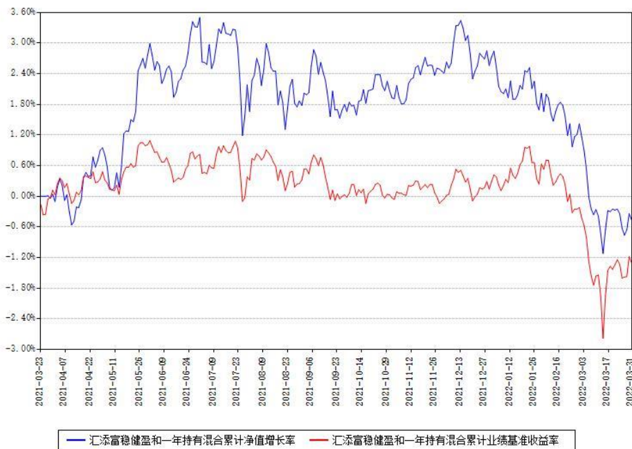
汇添富稳健盈和一年持有混合累计净值增长率与同期业绩基准收益率对比图