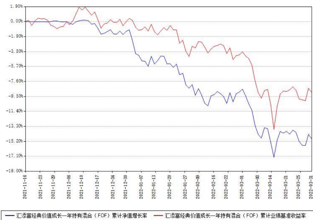
汇添富经典价值成长一年持有混合（FOF）累计净值增长率与同期业绩基准收益率对比图