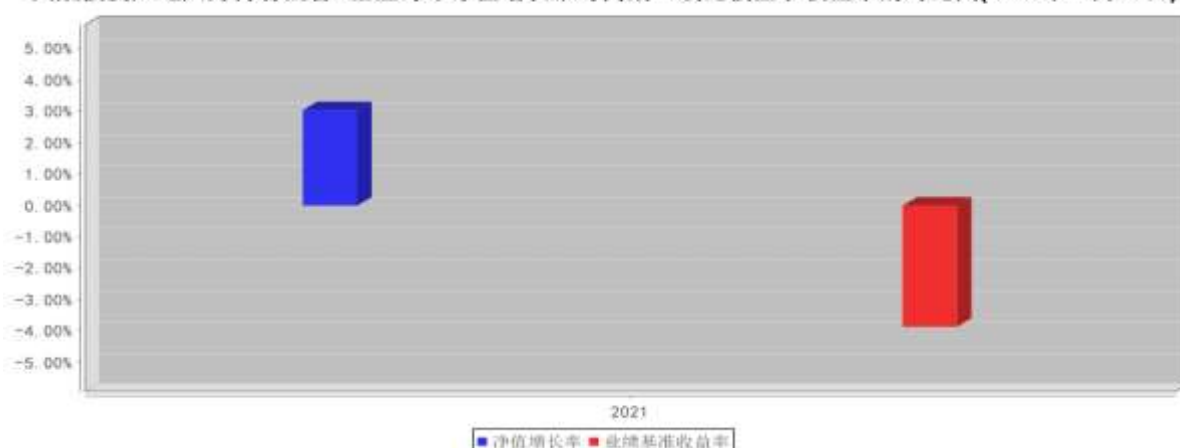
大成投资严选六月持有混合A基金每年净值增长率与同期业绩比较基准收益率的对比图(2021年12月31日)