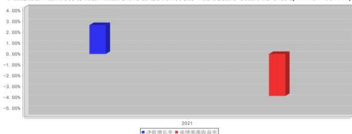
大成投资严选六月持有混合C基金每年净值增长率与同期业绩比较基准收益率的对比图(2021年12月31日)