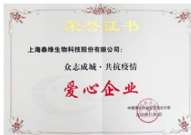
众志成城·共抗疫情爱心企业