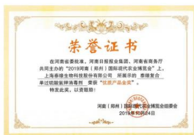
优质产品金奖-泰缘复合单过硫酸氢钾消毒剂