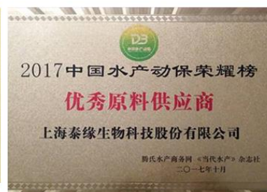
中国水产优秀原材料供应商