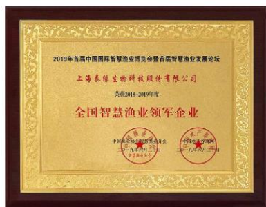
全国智慧渔业领军企业