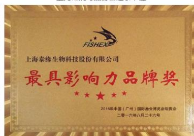
国际渔业博览会*具影响力品牌