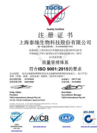
2015年质量管理体系认证证书