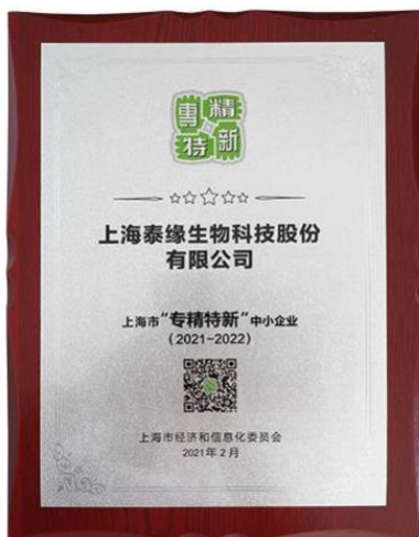
上海市专精特新中小企业