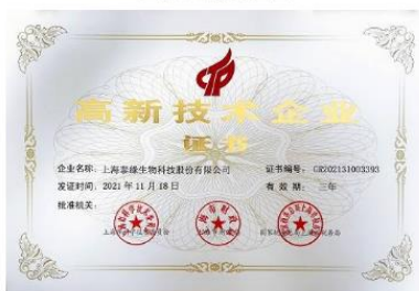
上海市高新技术企业