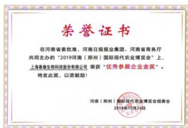
优秀参展企业金奖