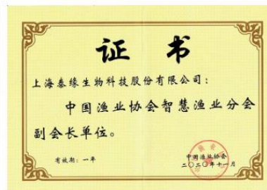
中国渔业协会智慧渔业分会副会长单位