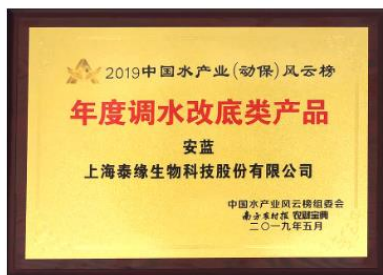
年度调水改底类产品-安蓝