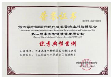
“十三五”全国智慧渔业优秀典型案例