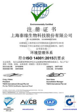
2015年环境管理体系认证证书