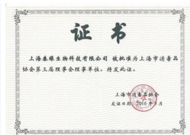
消毒品协会第三届理事会理事单位