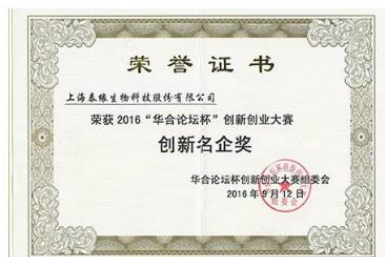
华合论坛杯创新名企证书