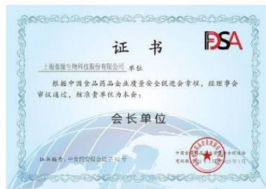
中国食药促进会会长单位