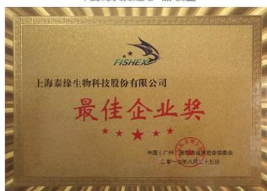
2017年国际渔业博览会*佳企业奖