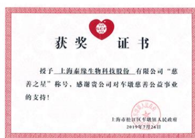
慈善之星获奖证书