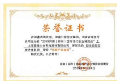
优质产品金奖-微生物原位激活修复袋