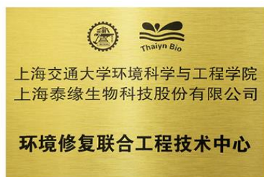
环境修复联合工程技术中心