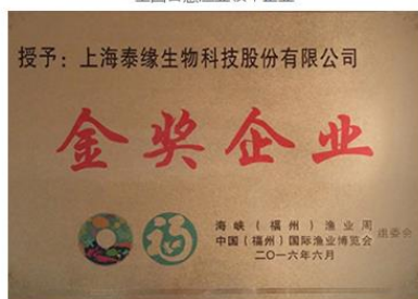
2016年国际渔业博览会金奖企业