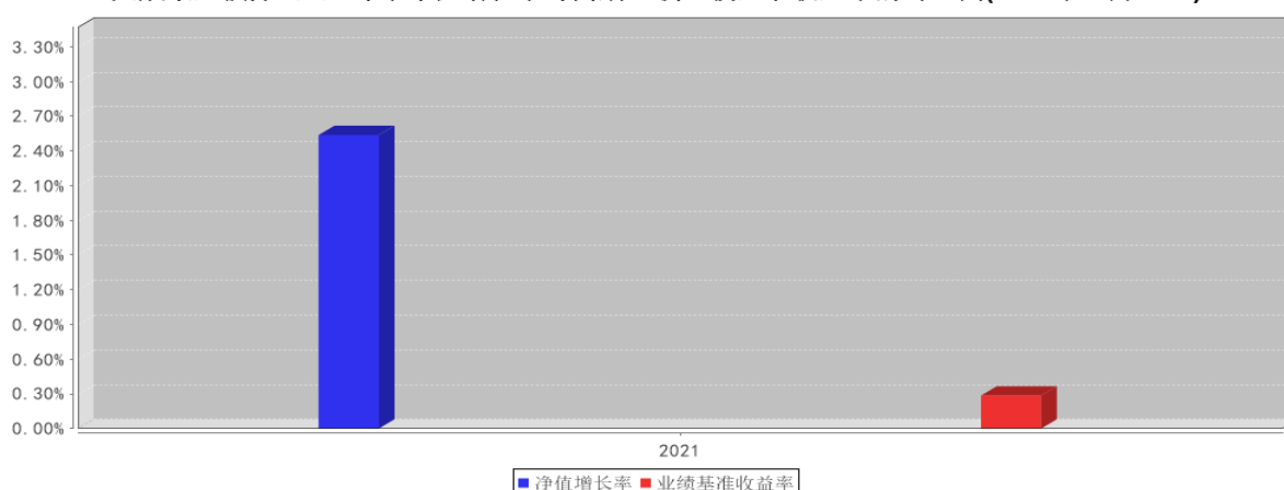
大成景盈债券C基金每年净值增长率与同期业绩比较基准收益率的对比图(2021年12月31日)