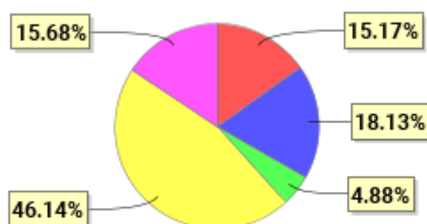
投资组合资产配置图表(2022年3月31日)