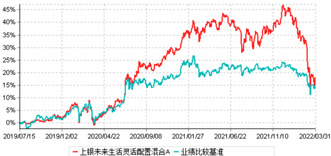
上银未来生活灵活配置混合A累计净值增长率与业绩比较基准收益率历史走势对比图 (2019年07月15日-2022年03月31日)