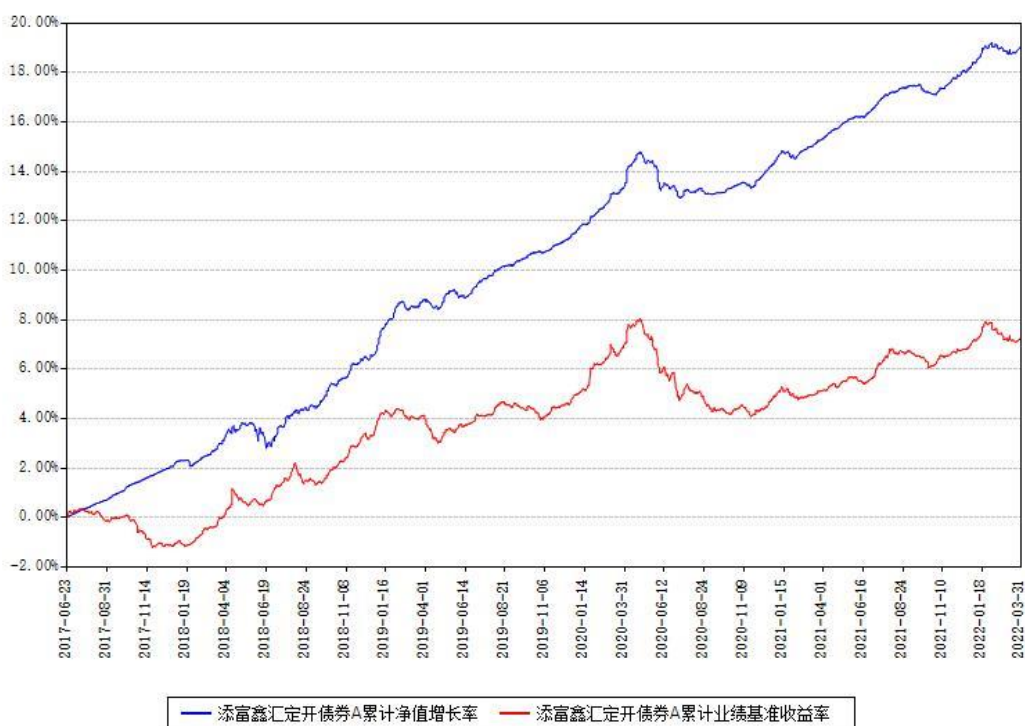
添富鑫汇定开债券A累计净值增长率与同期业绩基准收益率对比图

(二)自基金合同生效以来基金累计净值增长率变动及其与同期业绩比较基准收益率变动的比较图