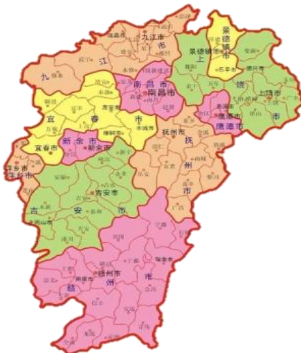
图 1：江西省行政区划图

上饶市为江西省地级市，下辖12个县区，位于江西东北部，与长三角经济区、海西经济区、皖江城市带经济区、鄱阳湖生态经济区“四区”交汇，为赣浙闽皖四省交界区域之地。交通方面，上饶市拥有以高速铁路、高速公路、三清山机场、宁波上饶无水港、福州港上饶码头为基本构架的海陆空综合立体交通网络。