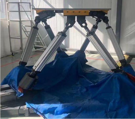
公司实验中心新增一台六轴振动实验设备