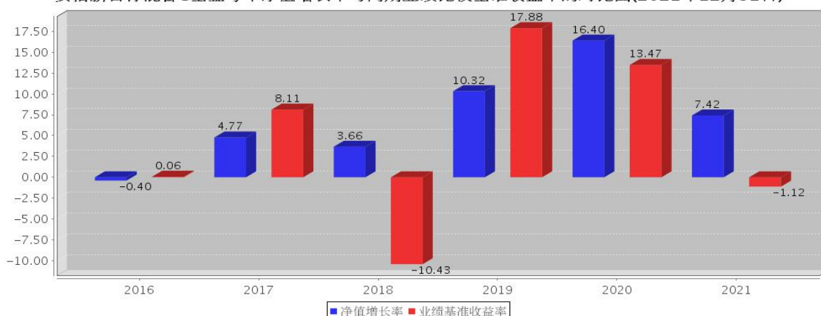
安信新目标混合C基金每年净值增长率与同期业绩比较基准收益率的对比图(2021年12月31日)

注: 基金合同生效当年期间的相关数据按实际存续期计算。基金的过往业绩并不代表其未来表现。