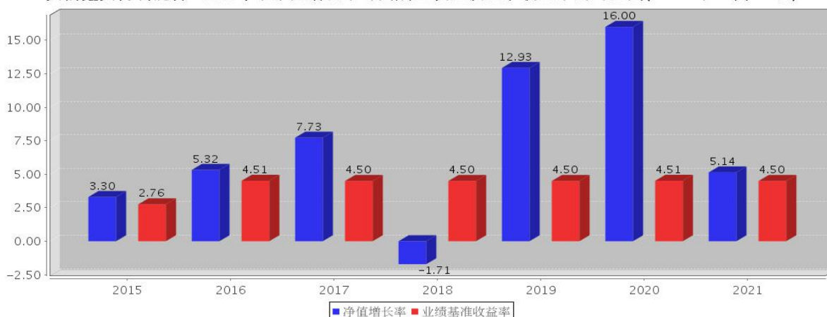
安信鑫安得利混合C基金每年净值增长率与同期业绩比较基准收益率的对比图(2021年12月31日)

注：基金合同生效当年期间的相关数据按实际存续期计算。基金的过往业绩并不代表其未来表现。