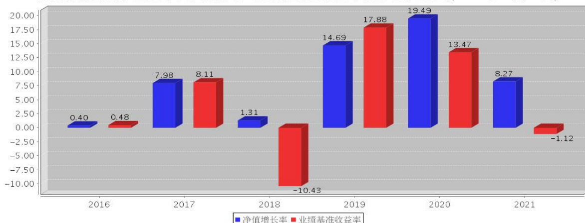
安信新优选混合C基金每年净值增长率与同期业绩比较基准收益率的对比图(2021年12月31日)

注：基金合同生效当年期间的相关数据按实际存续期计算。基金的过往业绩并不代表其未来表现。