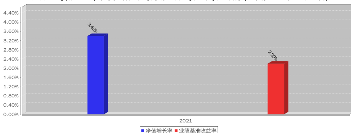
农银金玉债券基金每年净值增长率与同期业绩比较基准收益率的对比图(2021年12月31日)

注:1. 基金合同生效当年按实际期限计算, 不按整个自然年度折算。 2. 基金过往业绩不代表未来表现。