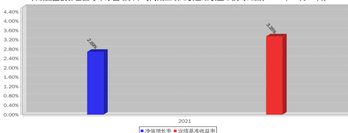
农银金盛债券基金每年净值增长率与同期业绩比较基准收益率的对比图(2021年12月31日)

注:1. 基金合同生效当年按实际期限计算，不按整个自然年度折算。 2. 基金过往业绩不代表未来表现。