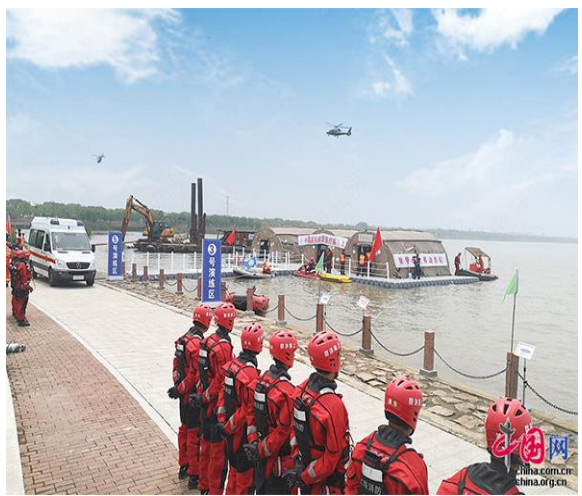
旗华专利技术“便捷式水上移动医院”首次亮相长三角水域应急救援实战拉动演练