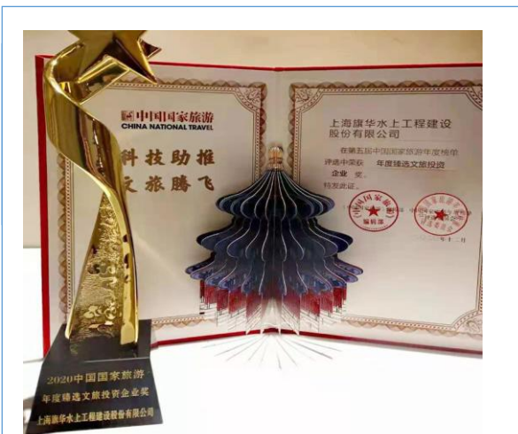
上海旗华在第五届中国国家旅游年度榜单评选中荣获“年度臻选文旅投资企业奖”