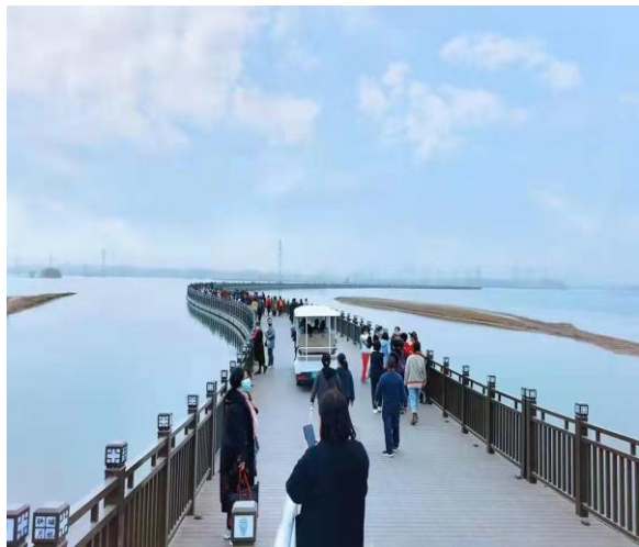
旗华打造国内首座采煤塌陷区 1.5 公里“网红车行浮桥”，助力河北省重点旅游区建设