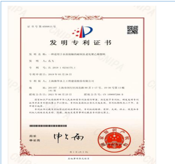
旗华又荣获一项水上专用抗长期老化复合改性新型环保材料发明专利，截止目前共获得 122 项专利