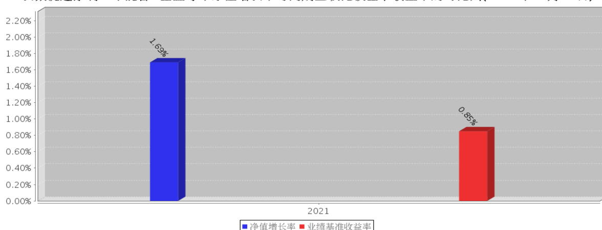
长城优选添利一年混合A基金每年净值增长率与同期业绩比较基准收益率的对比图(2021年12月31日)

注:基金过往业绩不代表未来表现。基金合同生效当年按实际存续期计算净值增长率,不按整个自然年度进行折算。