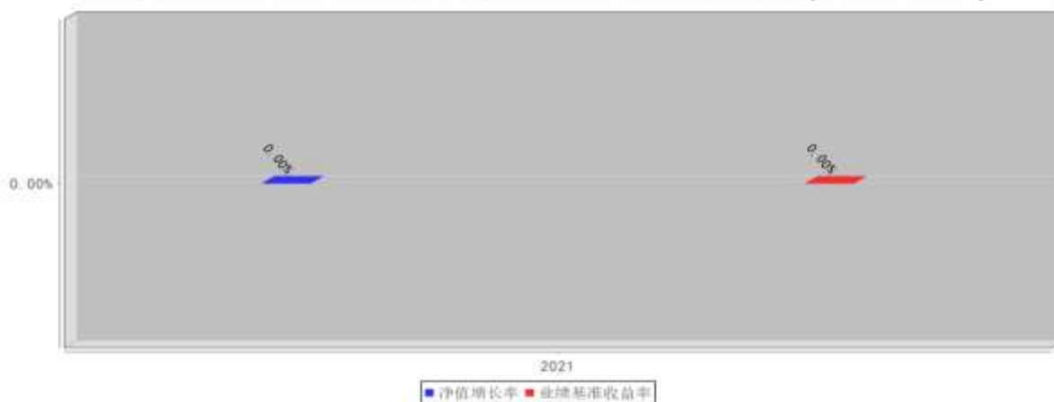
鑫元合享纯债D基金每年净值增长率与同期业绩比较基准收益率的对比图(2021年12月31日)

注:1. 业绩表现截止日期 2021 年 12 月 31 日。基金过往业绩不代表未来表现。