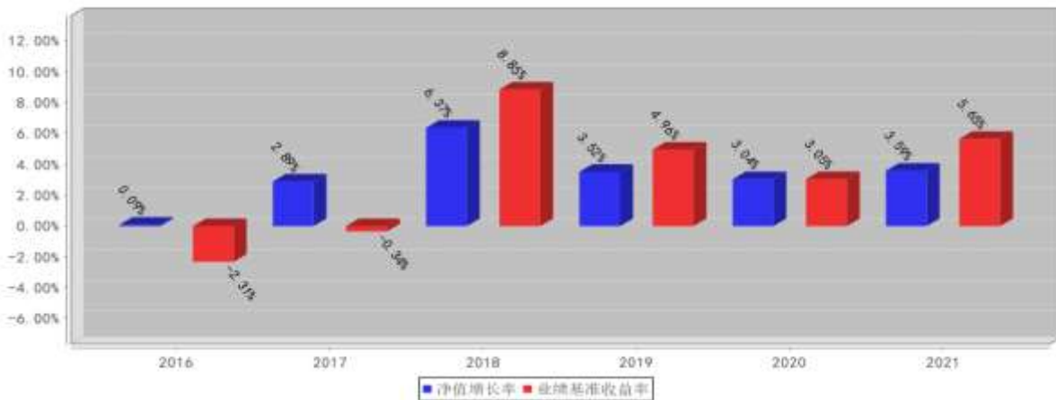
鑫元聚利基金每年净值增长率与同期业绩比较基准收益率的对比图(2021年12月31日)

注:1. 业绩表现截止日期 2021 年 12 月 31 日。基金过往业绩不代表未来表现。 2. 合同生效当年的本基金净值增长率与同期业绩比较基准收益率按实际存续期计算，不按整个自然年度进行折算。