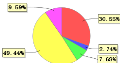
投资组合资产配置图表(2022年3月31日)

● 固定收益投资 ● 买入返售金融资产 ● 其他各项资产 ● 权益投资 ● 银行存款和结算备付金合计