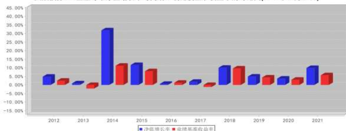
大成债券A/B基金每年净值增长率与同期业绩比较基准收益率的对比图(2021年12月31日)