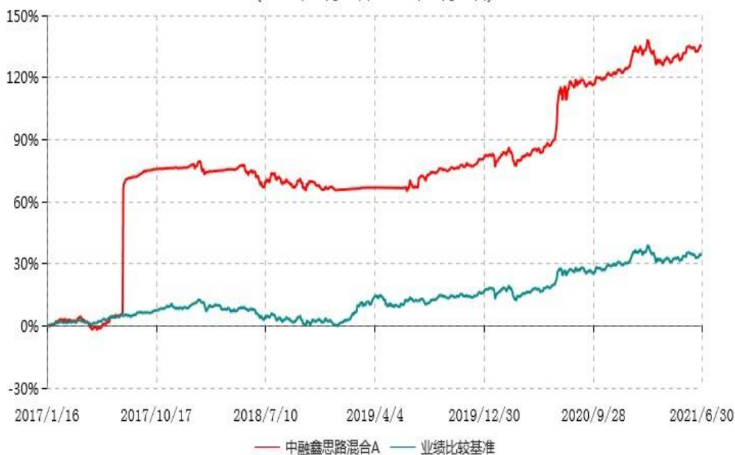
中融鑫思路混合A累计净值增长率与业绩比较基准收益率历史走势对比图 (2017年01月16日-2021年06月30日)