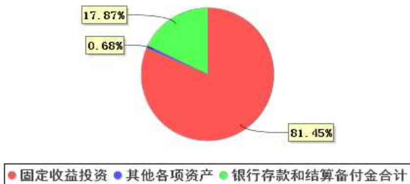
投资组合资产配置图表(2022年3月31日)