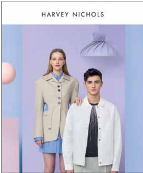
Fashionwear at Harvey Nichols. 於「Harvey Nichols」的時裝。