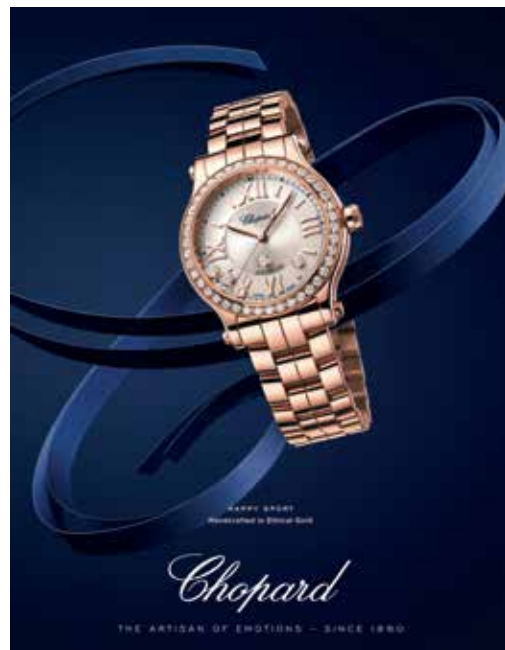
Chopard 'HAPPY SPORT' watch. 「蕭邦」的「HAPPY SPORT」腕錶。