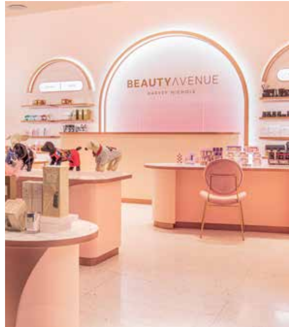
Beauty Avenue, the new beauty retail concept. 「Beauty Avenue」- 一站式化妝美容概念店。

台灣市場為本集團於本年度表現最強勁之市場，盈利創紀錄之新高。惟自二零二二年三月以來，台灣之強勁增長已被目前在台灣爆發的2019新型冠狀病毒Omicron變異病毒株疫情所影響。鑑於目前之情況，本集團非常關注台灣市場將受到影響之嚴重程度。