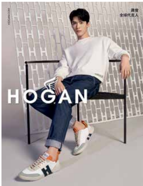
Shoes by Hogan. 「Hogan」鞋履。

在中國，本集團成功地重組架構，加上其零售業務表現強勁，使本集團在中國之業務持續取得溢利貢獻。然而，在二零二二年三月至五月於中國爆發的2019新型冠狀病毒Omicron變異病毒株疫情，引致商店多次臨時關閉及防礙正常物流與供應鏈之運作，嚴重影響實體零售店及網上零售之銷售表現。鑑於在中國之2019新型冠狀病毒疫情持續，本集團預期於今個財政年度中國之營商環境仍非常具挑戰性。