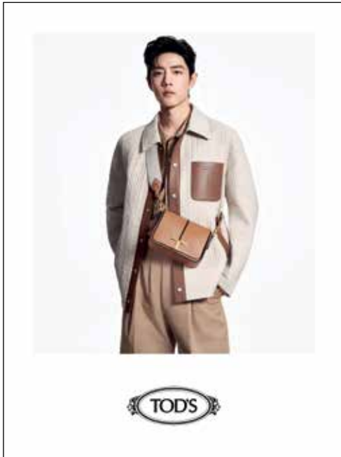
Handbag by Tod's. 「Tod's」手袋。